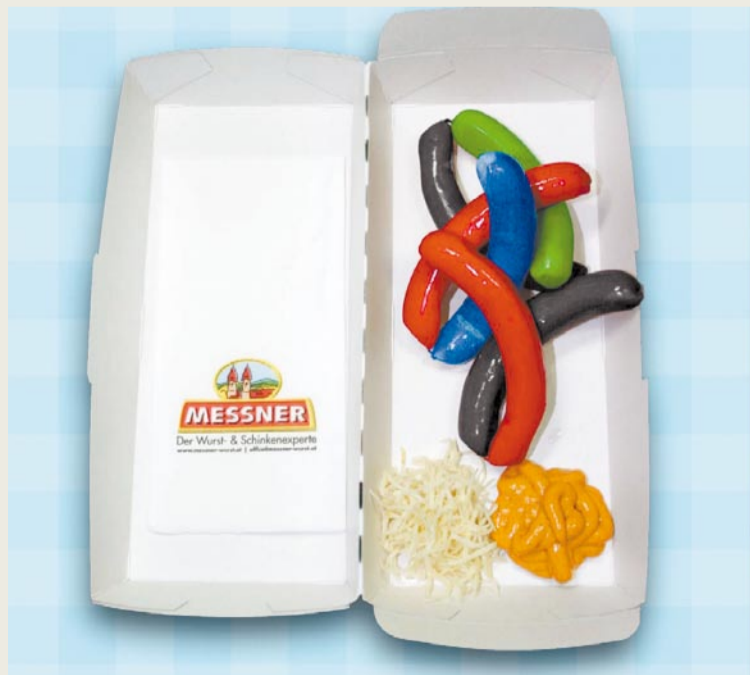
Ein kräftiger Schuss Farbe und ebenso viel Humor haben die bunte „Messner Würstel Vielfalt“ zum preisgekrönten Renner gemacht