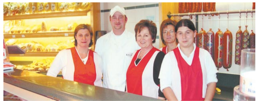
In der Fleischerei Loschy profitiert man vor allem vom Austausch mit Gleichgesinnten innerhalb der BONUS-Gruppe